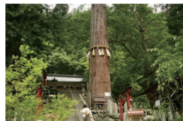
由岐神社の3本の神杉のひとつ、大杉社(願掛け杉)

他地方の杉に比べて幼い時代の成長は遅いものの、老木になっても同じ程度の成長を続けます。秋田杉ならではの木目がそろった木材は、成長に持続性があるからです。