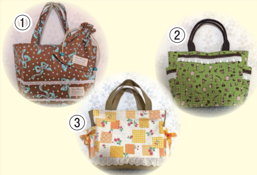
「トートバック」(3名様)

●応募方法 / ハガキに〈プレゼント番号・住所・氏名・年齢・電話番号・職業・新聞を読んだ感想〉を書いて、下記までお送りください。 〒739-1731 広島市安佐北区落合4-1-7 マルコシ内「プレゼント」係