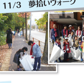
第5回 夢拾いウォーク