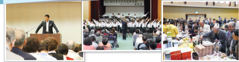
東日本大震災復興支援チャリティ

28 27 25 24 20 18 13 11 10 4 3 新・人生講座 懐かしい映画 編物教室 人生講座 日本の言葉 古代への道 山田ツアー 人生講座 新・広島学 講座ツアー 俳句歳時記 14 19 184 92 92 92 185 92 185 92 33