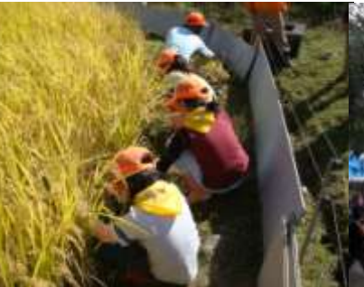
▲10月塾 稲刈りなど 5月にみんなで植えた苗が大きく成長したね！新米が楽しみだ！