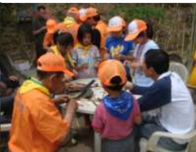
▲6月塾 木工教室など 水鉄砲や竹とんぼ。お父さんに手伝ってもらって作ってみよう！