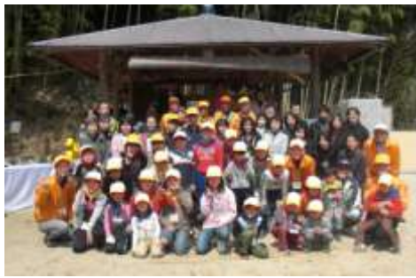
▲4月塾 入塾式など 27名の子どもたちが元気な笑顔で入塾。 たくさんの思い出を作ろうね。