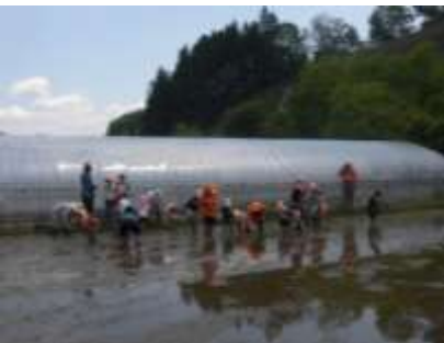
▲5月塾 田植えなど 泥んこになりながらの作業。 ほんとお米ができるかな？ 手で植えるのって大変だね。