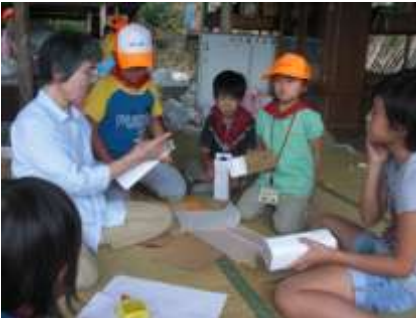
▲ホームステイ 万華鏡作りなど 牛乳パックを使って世界に一つだけのオリジナル万華鏡。カラフルな模様がきれいだね。