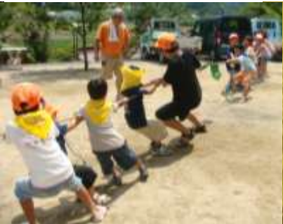
▲9月塾 竹林運動会など チーム対抗運動会！どろんこになっても優勝目指して頑張るぞ～！