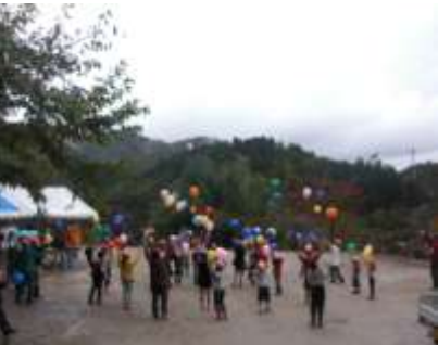
▲11月塾 卒塾式など 8ヶ月って長いようであっという間だね。「つくしクラブ」のみなさんにはとってもお世話になりました。