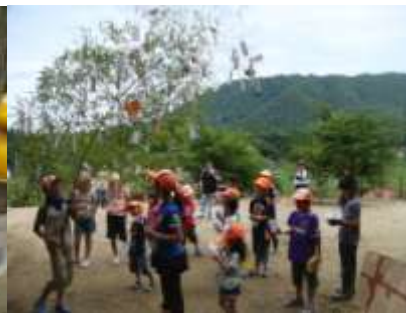
▲7月塾 七夕作りなど お願いごとをたくさん短冊に書いてね。 きっと神さまが適えてくれます。