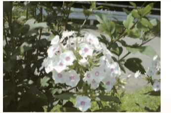
花魁草 (おいらんそう)

花言葉は「あなたの望みを受けます」 【溫和】 はなしのぶ科クサキョウチクトウ（フロックス）属 多年草で原産地は北アメリカ。園芸品種として持ち込まれたものが野生化し、北海道〜九州に分布。名の由来は、花の香りが花魁の白粉に似ているからという説、花の艶やかさを花魁に見立てたという説もある。